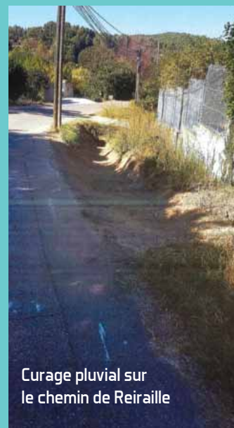
Curage pluvial sur le chemin de Reiraille