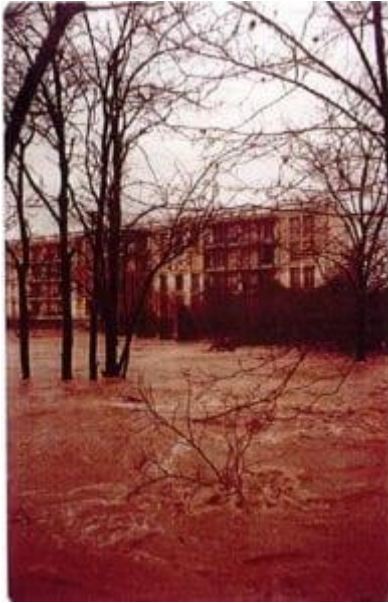
Centre-ville d'Aubagne le 18 janvier 1978

En 1978, des milliers de personnes avaient été touchées par les débordements de l'Huveaune. Malgré la météo qui a tendance à « épargner » notre territoire, nous sommes vulnérables, ne l'oublions pas. Une crue éclaircie notamment localisée sur Marseille avait causé trois morts en septembre 2000. Pour rappel, voici quelques photos de l'Huveaune en crue.