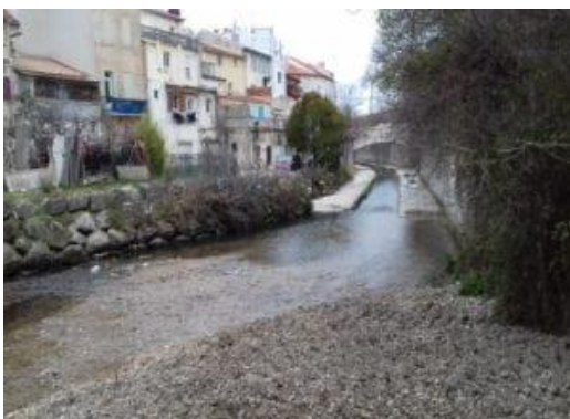
Après opération de retrait de l'atterrissement