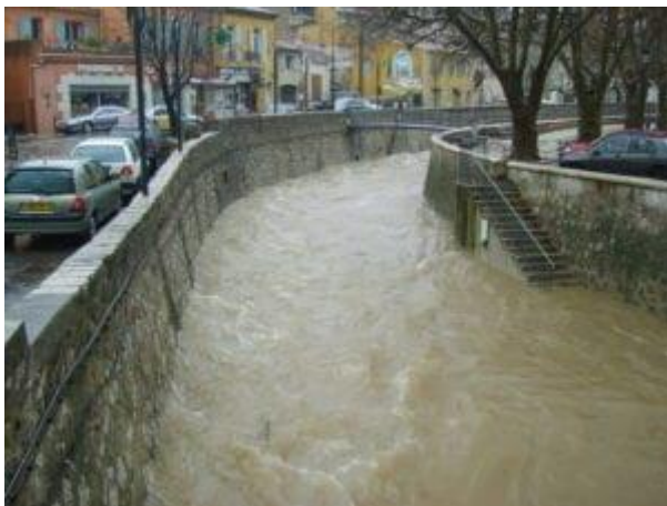
L'Huveaune à Auriol / crue de décembre 2008 (pas de débordements majeurs en 2008)

En 1978, des milliers de personnes avaient été touchées par les débordements de l'Huveaune. Malgré la météo qui a tendance à « épargner » notre territoire, nous sommes vulnérables, ne l'oublions pas. Une crue éclaircie notamment localisée sur Marseille avait causé trois morts en septembre 2000. Pour rappel, voici quelques photos de l'Huveaune en crue.