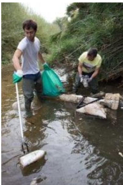
Ramassage de déchets dans l'Huveaune à La Penne sur Huveaune – Opération « Huveaune Propre 2018 »