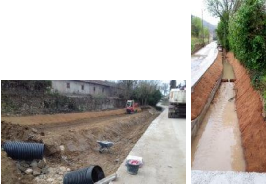
Recalibrage, confortement génie végétal

Les travaux ont consisté à élargir le cours d'eau en retirant des aménagements bétonnés au profit d'un confortement de berges par génie végétal. Le risque de débordement se voit ainsi diminué par la création d'une zone d'expansion de crue et la mise au gabarit de 3 passerelles de franchissement du cours d'eau.