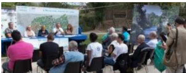
Point presse de clôture de l'opération « Huveaune Propre 2018 » – occasion de remercier toutes les structures volontaires et les citoyens mobilisés et de formaliser une

Si l'objectif final est bien de « nettoyer » le cours d'eau, l'opération « Huveaune Propre » ne peut y répondre que ponctuellement et de manière localisée ; elle vient exprimer une volonté de changement face à cette problématique et sensibiliser, éduquer, les participants et le grand public à ce sujet et aux bonnes pratiques à adopter . Une opération d'une telle ampleur permet notamment d'amorcer la mise en place d'un plan d'actions global et durable pour éviter la présence de déchets dans le milieu naturel (réduction à la source). En effet, le SIBVH s'investit dans la construction d'une stratégie « déchets » qui vise à mobiliser sur le sujet les acteurs générateurs de déchets, les particuliers et activités riverains des cours d'eau... tous déjà sensibilisés ou non face à cette réelle problématique sur notre territoire.