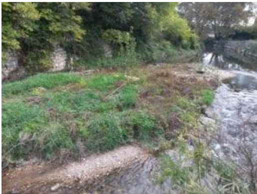
Présence d'un atterrissement