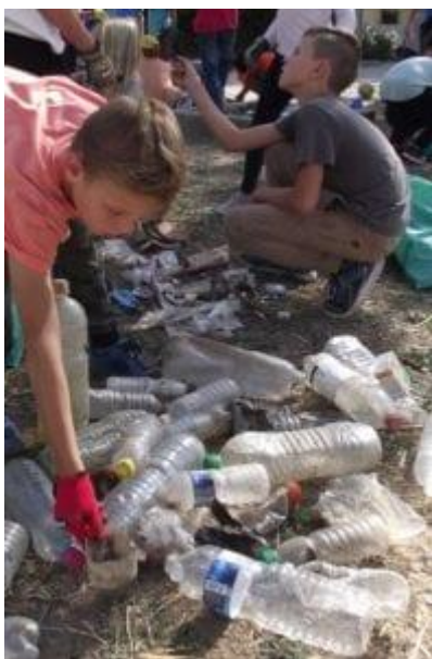
Tri et comptage des déchets – Opération « Huveaune Propre 2018 » – Ecole Primaire Leï Barquieu Lascours – Roquevaire