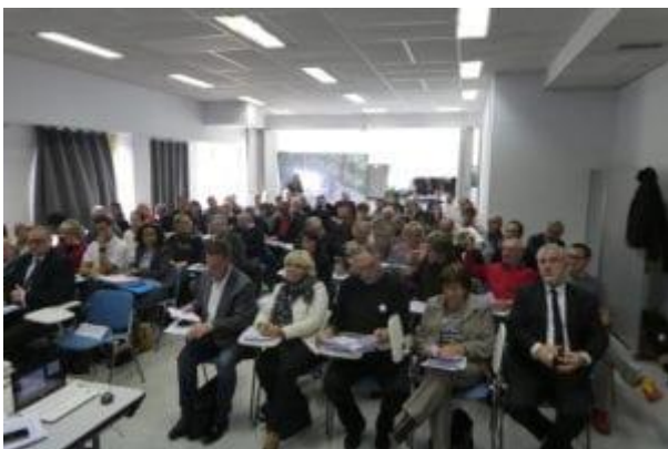
Séance du Comité de Rivière du 10 décembre 2017

Le Syndicat de l'Huveaune, en tant que porteur du dispositif, consolide actuellement avec ses partenaires le bilan à mi-parcours préfiguré lors du Comité de Rivière de décembre 2017.