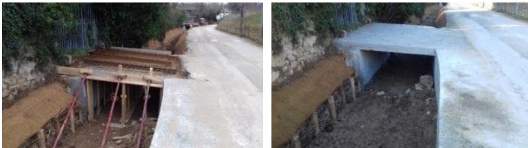
Mise au gabarit des passerelles de servitudes riveraines