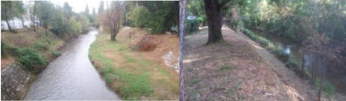
État du cours d'eau après entretien