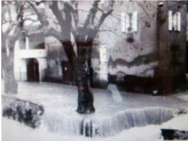
Centre-ville de Roquevaire – inondation de janvier 1978

En effet, la connaissance de chacun est importante et permet d' enrichir la démarche du SIBVH par un apport de données terrains précieuses et par l'identification de besoins sur lesquels travailler.