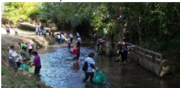
Ramassage de déchets dans l'Huveaune à Aubagne (amont du parc des Défensions) – Opération « Huveaune Propre 2018 » – Ecole primaire Pin Vert