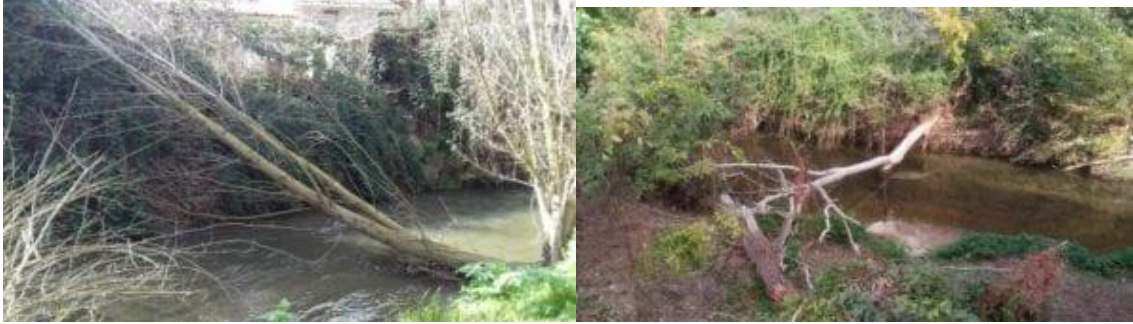
Présence dans le lit d'arbres morts formant des embâcles