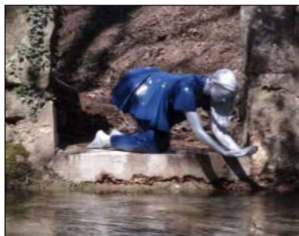
Marie, l'une des 5 fées de l'Huveaune

A plus long terme, nos ressources locales ne seront jamais aussi bien préservées qu'après une réelle réappropriation des richesses que nous offrent nos territoires !