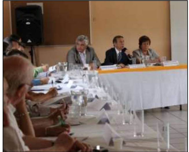
Comité de Rivière du 24 juin 2014 à Roquevaire

Pour assurer la co-construction de projet définitif et rédiger les fiches du plan d'actions, le syndicat, avec l'appui du bureau d'études Safege et de l'agence Génopé, organisera entre novembre 2014 et juin 2015 :