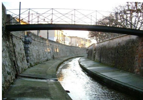
L'Huveaune, un fleuve très contrasté