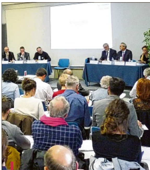
Le bilan d'étape du Contrat de rivière a été présenté mercredi au Centre de congrès Agora, à Aubagne.

Si les élus et professionnels présents mercredi se félicitaient de l'amélioration de la qualité de l'eau, les informations pré-