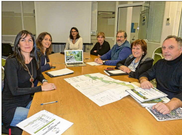
Les responsables du SIBVH et de la Métropole ainsi que les élus travaillent sur le projet.

L'objectif de ces deux projets Gémapi (Gestion des milieux aquatiques et prévention des inondations) est de proposer un aménagement conciliant le volet vulnérabilité à la restauration géomorphologique du cours d'eau et l'intégration dans le cadre de vie des habitants.